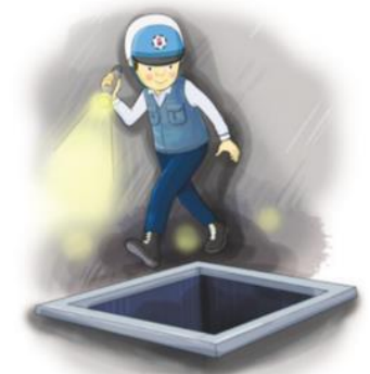
휴대용 랜턴으로 충분한 시야 확보