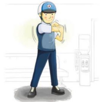
운행 전·후 스트레칭 실시