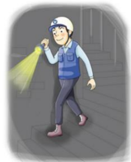
야간순찰 시 휴대용 조명등을 사용