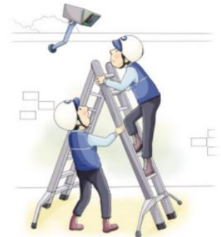
사다리 작업 시 2인 1조 작업 실시